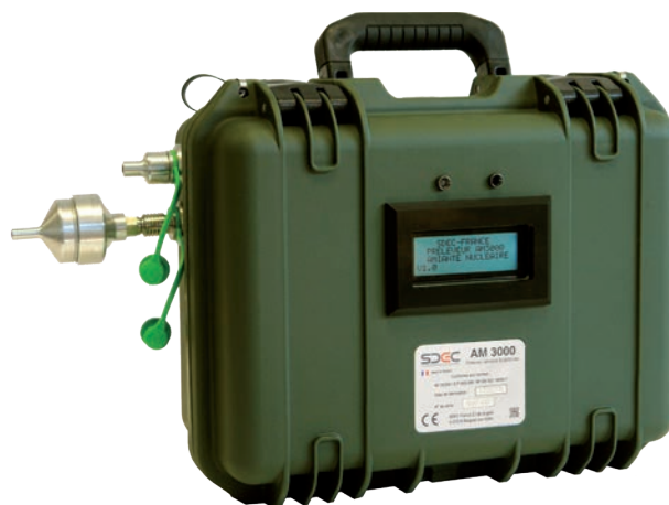
AM 3000 N avec porte-filtre THE

Répondant aux exigences des normes NF43-050, NF X43-269 et NF EN ISO 13137, il vous garantira un prélèvement représentatif des fibres d'amiante dans l'air.