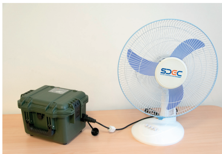
Le Pack Batterie relié à un ventilateur SDEC France